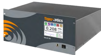
HALO OK 基于CRDS技术的痕量O 2 分析仪