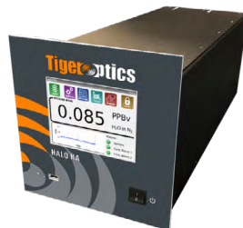
HALO KA H 2 O 实时分析特气中ppt级别的H 2 O