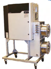
MAX300-AIR 分析环境和环境空气的 质谱仪