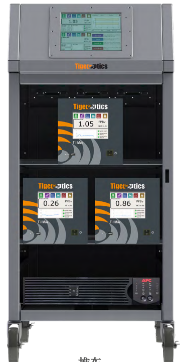
推车 监控AMC的移动式 解决方案