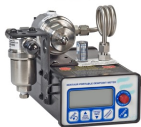
HDT / XPDM / LPDT 系列 便携式/固定式/回路供电式 采用超薄膜技术的氧化铝露点仪