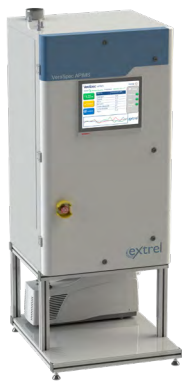
VeraSpec APIMS 高性能，连续分析ppt级别杂质的质谱仪