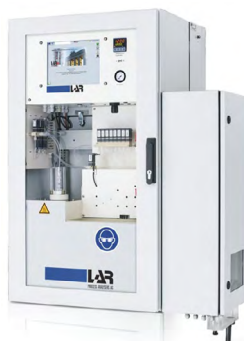
QuickTOCpurity 纯水和工艺过程应用的 水质分析仪