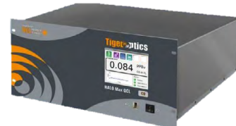
HALO Max QCL 实时分析电子气中ppt级别的CO和CO 2