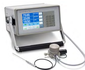
Model 473 冷镜法露点仪和湿度发生器