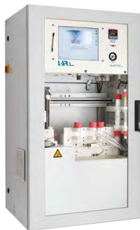
QuickTOCultra 复杂废水应用的 水分析仪