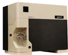
MAX300-LG 适用于实时分析洗涤器的 质谱仪