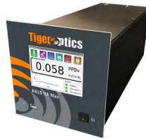
HALO KA Max 分析电子气中ppt级别的H 2 O、CH 4 和NH 3