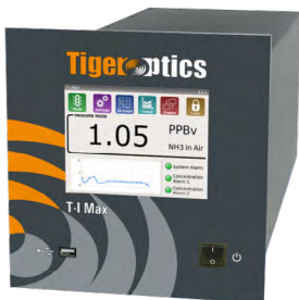
T- I Max HCl