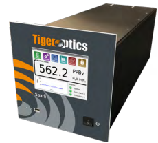
Spark 纯化前微量杂质分析 H 2 O、CH 4 、CO、CO 2 、C 2 H 2