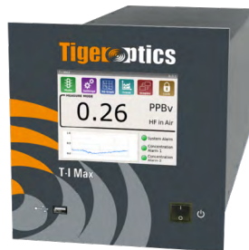
T- I Max NH 3