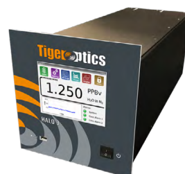
HALO 3 实时分析ppb级杂质气体分析仪