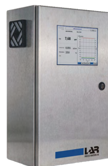
QuickTOCtrace 超纯水应用的 水分析仪