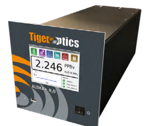
ALOHA+ H 2 O 用于超纯氨气中ppt级H 2 O的分析仪