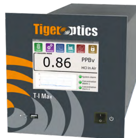
T- I Max HF