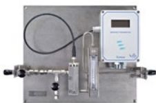
XDT系列 可配置定制化的集成系统