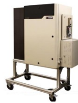
MAX300-RTG 用于过程控制的多流 路质谱仪