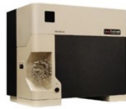
MAX300-LG 实时分析ppb级别各 种杂质的质谱仪