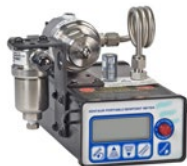
HDT / XPDM / LPDT系列 便携式、固定式、回路供电的氧化铝露点仪