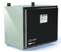
CO-rekt 实时分析H 2 O, CO, CH 4 和CO 2 杂质的气体分析仪