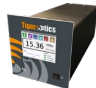
CRDS技术分析H 2 O, CH 4 , CO, CO 2 , 和C 2 H 2 等微量杂质